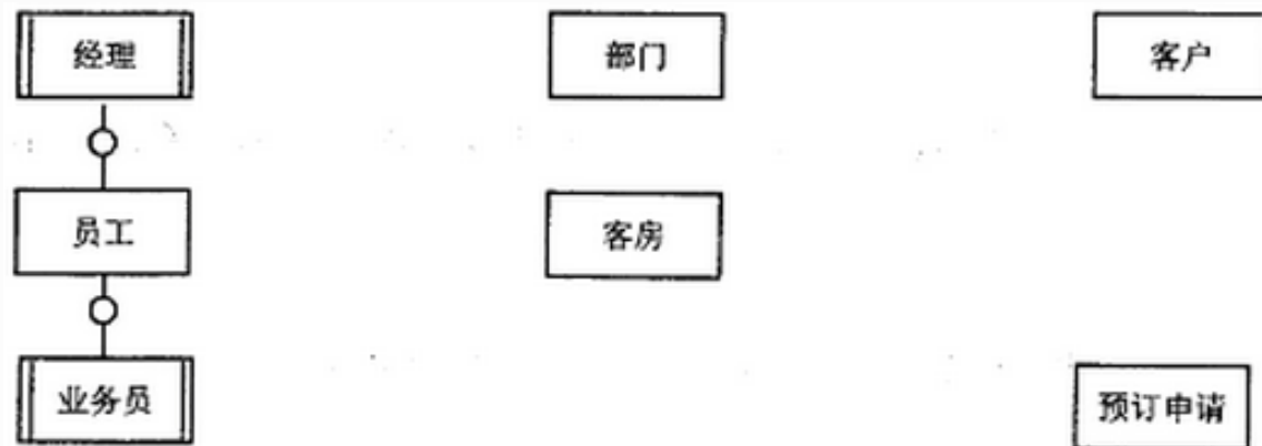
图 2-1 实体联系图